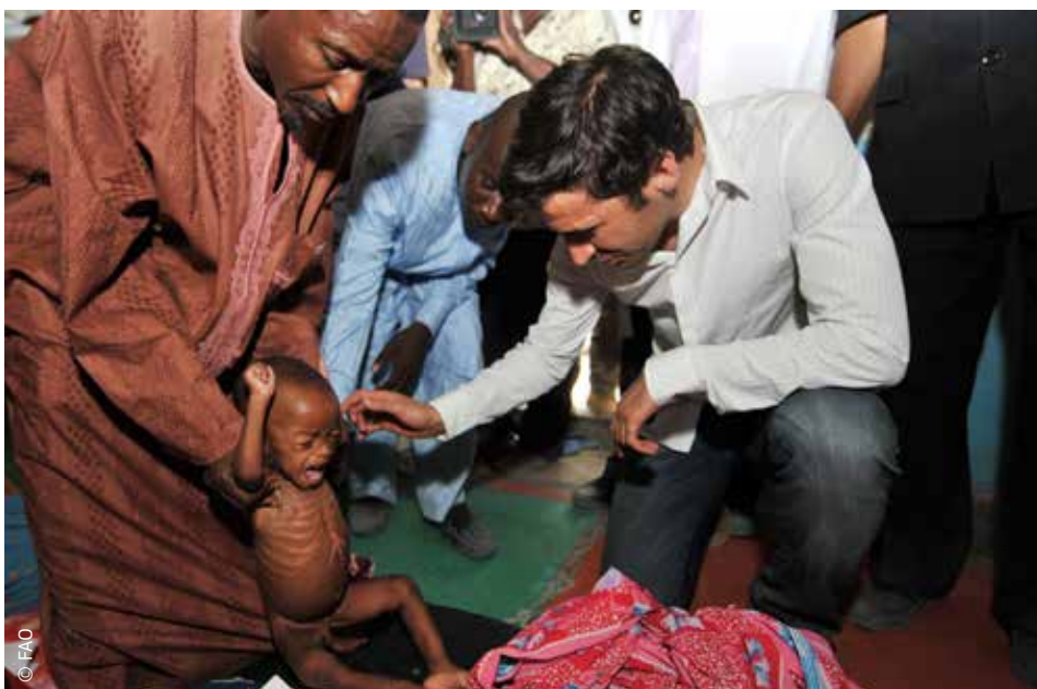
Raúlís Gonzálezas per kampaniją „Futbolas prieš badą“ apsilankė Čade.

Pagalbai maistu skirta didžiausia ES humanitarinės pagalbos biudžeto dalis. 2011 m. ES humanitarinei pagalbai maistu iš viso skyrė 509 mln. eurų.