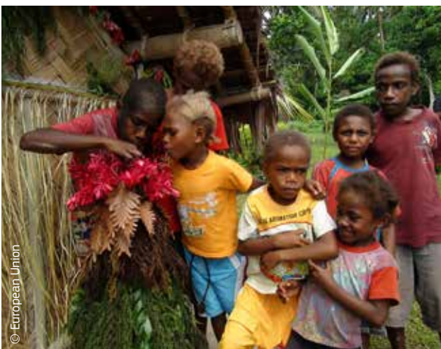
Vanuatu vaikai padeda kurti didžiausią grėsmę jų gyvybei keliančio ugnikalnio Mount Gharat modelį.

Europos Komisijai sutelkus dėmesį į atsparumo didinimą, bus išgelbėta daugiau gyvybių, veikla bus ekonomiškai efektyvesnė ir padės sumažinti skurdą. Dėl to padidės pagalbos poveikis ir bus skatinamas tvarus vystymasis.