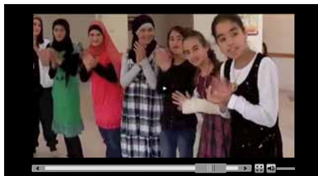
Mokymasis padeda vaikams išlikti vaikais per konfliktus.

Atsižvelgdama į tai, Europos Komisija paragino savo partneres humanitarines organizacijas ir agentūras pasiūlyti tinkamus finansuoti projektus. Po to buvo nuspręsta, kad Nobelio taikos premijos pinigai turėtų būti skirta keturiems projektams pagal iniciatyvą „EU Children of Peace“. Pagal šiuos keturis projektus bus padedama daugiau kaip 23 000 vaikų Irake, Kolumbijoje, Ekvadore, Etiopijoje, Demokratinėje Kongo Respublikoje ir Pakistane. Jiems bus suteikiama galimybė įgyti pagrindinį išsilavinimą, įrengiamos vaikams tinkamos patalpos, suteikiama apsauga ir šviesesnės ateities perspektyvos.