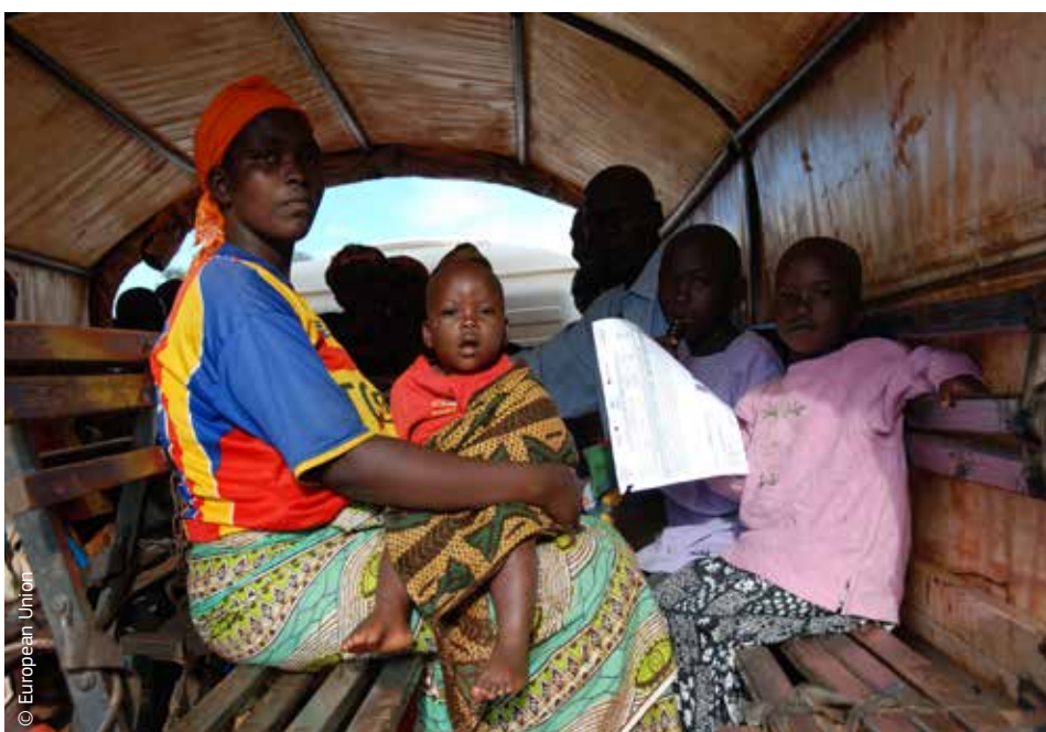
Ši anksčiau perkelta Burundžio šeima galėjo grįžti namo dėl ES paramos.

Kad būtų galima kontroliuoti ilgalaikį nelaimių poveikį ir imtis prevencijos bei parengties priemonių, humanitarinę pagalbą ir krizių valdymą reikia derinti su kitų sričių, įskaitant vystomąjį bendradarbiavimą ir aplinkos apsaugą, veikla. Norint tai daryti itin svarbus koordinavimas ES lygmeniu.