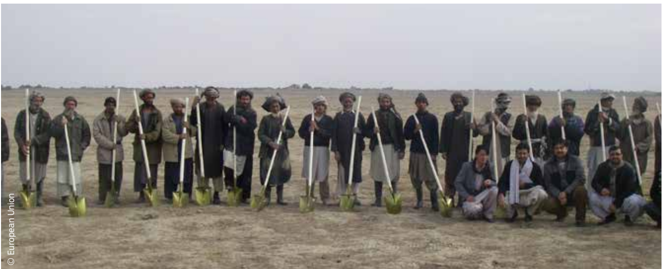
Afganistano gyventojai gavo ECHO finansuotų įrankių, kad galėtų kovoti su sausra, dėl kurios kilo badas ir žmonėms teko palikti namus.

2007 m. ES institucijos ir 27 valstybės narės susitarė dėl svarbaus politinio dokumento „Europos konsensusas dėl humanitarinės pagalbos“. Jame pabrėžta, kad Europos Sąjungos humanitarinė pagalba nėra politinė priemonė ir dar kartą patvirtinti pagrindiniai humanitarinės pagalbos