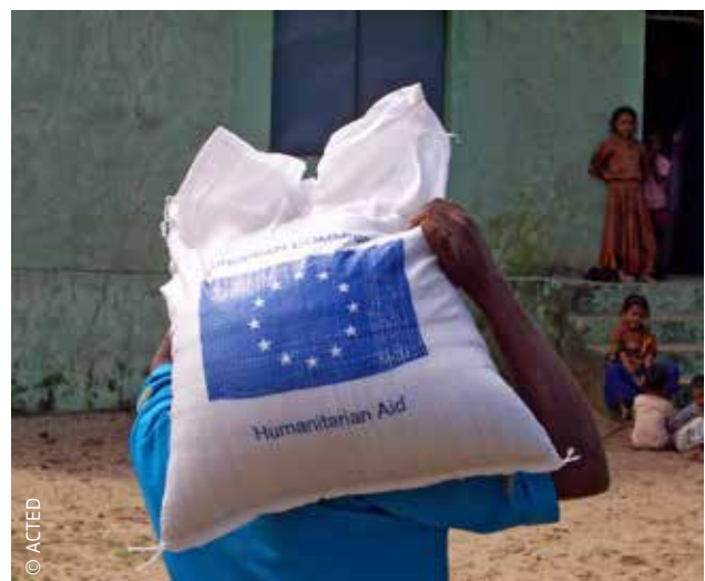
ES nuo 1996 m. skiria lėšų humanitarinei pagalbai Indijoje.

Europos Sąjunga yra viena iš didžiausių pasaulio humanitarinės pagalbos teikėjų. Ši pagalba nepaprastai svarbi ją gaunantiems žmonėms. Vien 2012 m. ES padėjo 122 mln. žmonių daugiau kaip 90 ES nepriklausančių šalių.